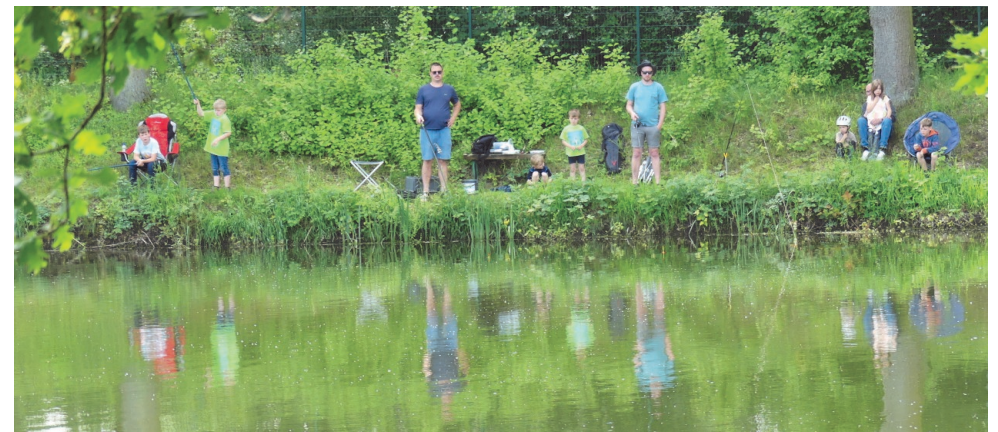
Unten: Campingfreizeit am Sonnensee (Versmold) Juni 2024

Änderungen unseres Programms wollen wir nach Möglichkeit vermeiden. Sollte es dennoch zu Änderungen kommen, werden diese in den Gruppenabenden oder auf unserer Internetseite bekannt gegeben.