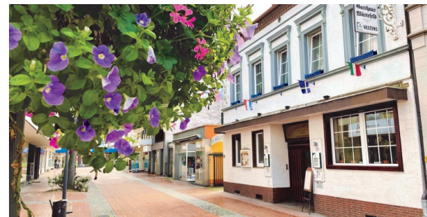
„Gasthaus Wüstefeld“ in Hörde, Hörder Rathausstraße 3

27.03.2025 Stammtisch: 17:00 Uhr im „Gasthaus Wüstefeld“ in Hörde, Hörder Rathausstraße 3