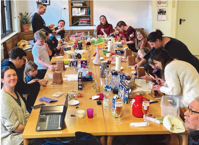
Nikolausfreizeit 2024 in Evingsen - wir basteln Knusperhäuser